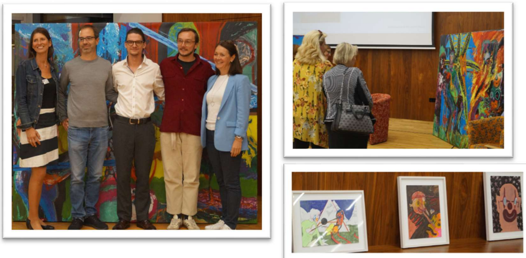
Abb.3: Veranstaltung 5.10.2023, Bildungshaus St. Hippolyt