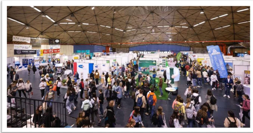
Abb.1: Job- und Bildungsmesse HL 3.500 Besucher*innen zur Messe, davon 1000 Schüler*innen aus der Gegend zwischen Laa und Korneuburg