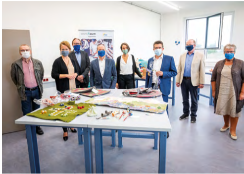
v.l.n.r.: J. Bauer, C. Teschl-Hofmeister, A. Schneider, M. Kaukal, U. Höhne, P. Eisenschenk, E. Ladinsler, E. Pfeiffer

Der werkRaum Tulln feierte nach knapp zwei Jahren Planungs- und Bauzeit am 1. September 2020 die Eröffnung seines neuen Standortes in der Kaplanstraße 23.